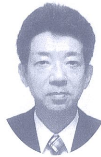
諫早市立北諫早中学校長