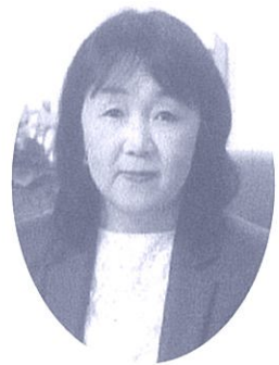
時津町立時津東小学校長