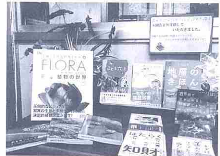
(長崎市立三和中学校)