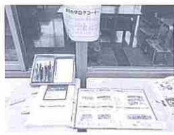
付箋でいっぱいのカタログ