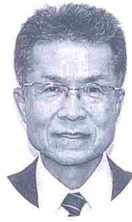
新上五島町教育長