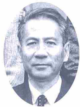
長崎市立西北小学校長