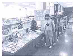
貸し出し初日の行列

ありつたけの本のカタログを子供たちの目につくところに置き、欲しい本に付箋を貼ってもらいました。広げたカタログにはたくさん付箋がついていました。また、クラスごとにアンケート用紙を配り、欲しい本を書いてもらいました。ある程度希望が集まったところで、図書室にあるものかどうかを調べ、無い本の中から希望人数が多い順に購入しました。子供たちからは「まだ、来ないんですか？」と心待ちにしている声が聞かれました。