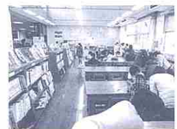
図書室奥の学習スペース

また、本棚の場所を移動し、入口の近くにも本が並べました。廊下を通る時にも本が良く見えるようになりました。そして、学習するスペースを部屋の奥の方に移動し、落ち着いた雰囲気の本が読めるようにしました。本棚が移動したことで、本もすべて並べ替えましたが、古い本を廃棄したり、分類ごとに並べなおしたりと、自分が図書室にある本を再確認する上でも役に立ちました。