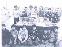
玉園文庫と委員会の子供たち