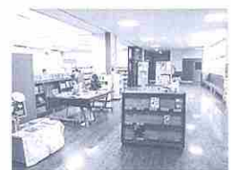
廊下から見たオープン図書室