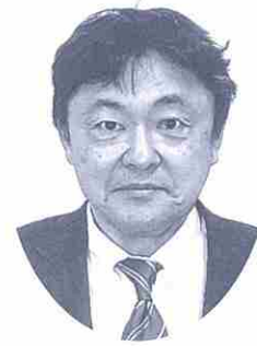
諫早市立高来中学校長