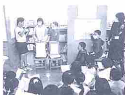
宝くじ抽選の様子