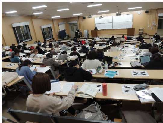
< 6校時に開催する教員採用試験特別講座 >